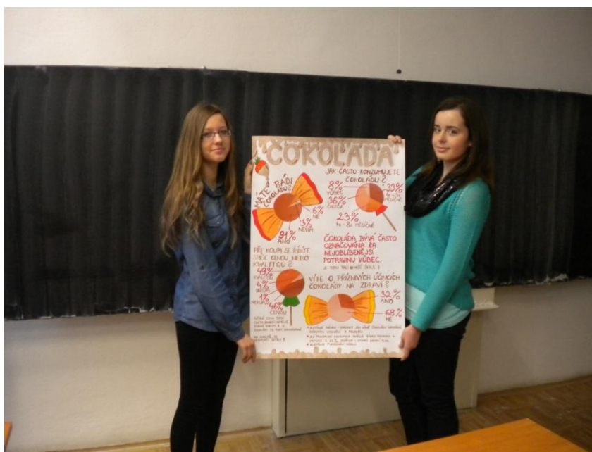
Statistický plakát, který získal druhé místo v celostátní soutěži pořádané v Praze